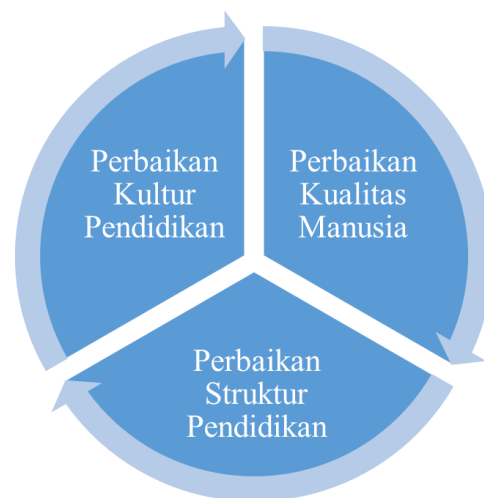
Gambar 3. Perbaikan Pendidikan Di Indonesia

Dengan demikian, pelbagai persoalan pendidikan nasional di Indonesia yang kompleks, dan berat tersebut merupakan tantangan yang harus segera diurai. Menurut hemat saya, ada tiga hal yang harus dilakukan: (1) perbaikan kualitas manusia; (2) perbaikan struktur pendidikan; (3) perbaikan kultur pendidikan. Lihat Gambar 3. berikut ini: